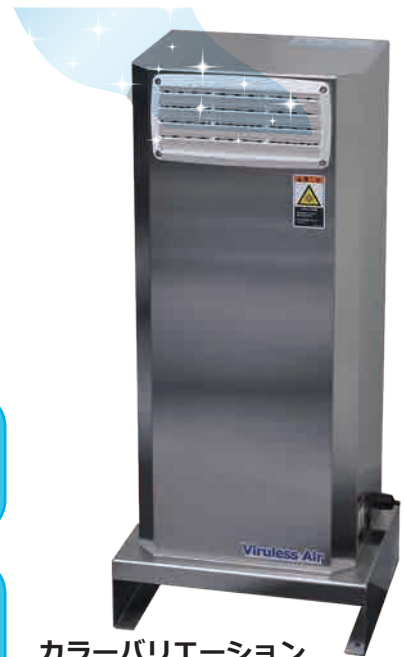
カラーバリエーション