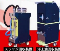
スラッジ回収装置 浮上油回収装置