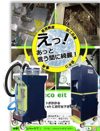
スラッジ回収装置

実機デモを行いながら、成功事例のご紹介や最適な仕様のご提案をさせて頂きました。沢山のお客様から加工現場、洗浄現場へ導入したい、とのお声を頂いています。回収装置デモの他にも、何かご不明な点等ございましたら、お気軽にご連絡ください。